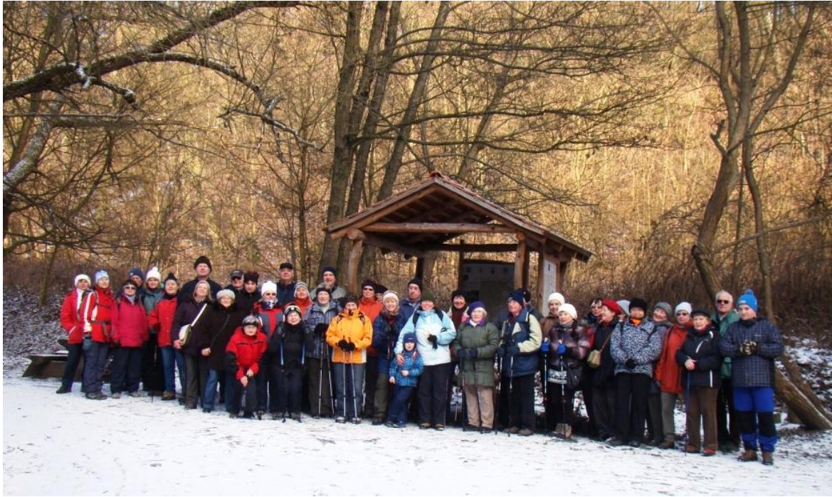
Účastníci zimní vycházky Krajem lišky Bystroušky