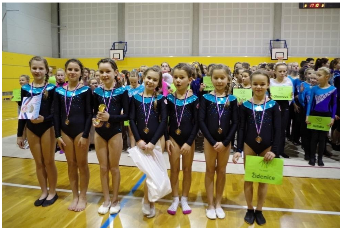
TGJ: Mladší žákyně kategorie I ze Sokola Židenice se probjovaly do finále ČOS