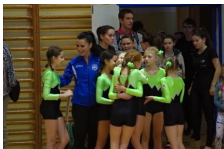
MO MTG: Vítězné družstvo mladších zákyň, kat. I (Sokol Židenice)