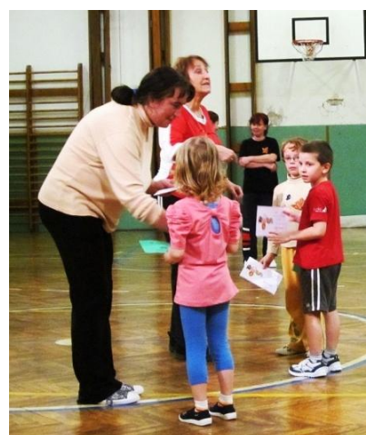
a vítězové přebírají diplomy.